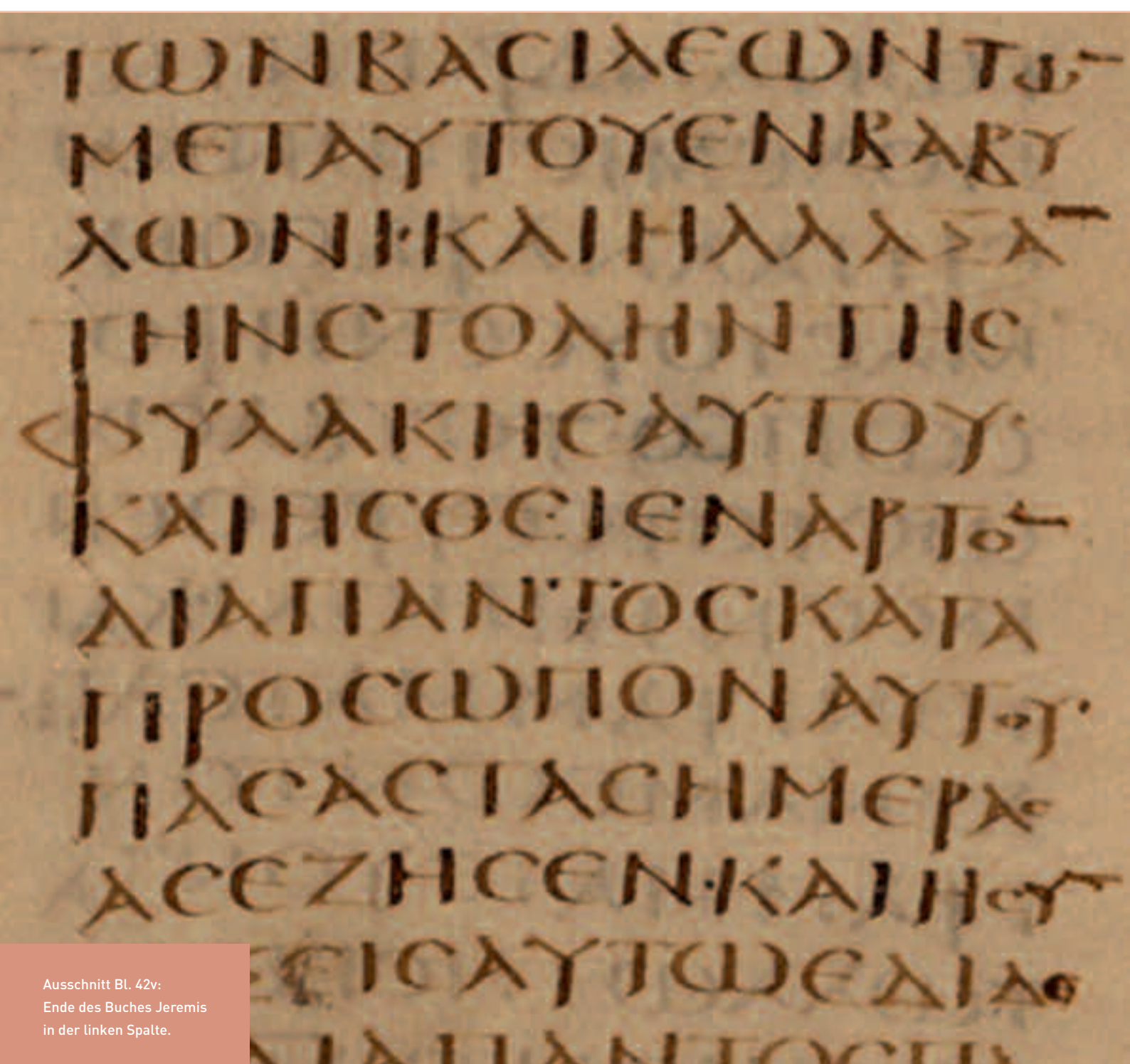
Ausschnitt Bl. 42v: Ende des Buches Jeremis in der linken Spalte.