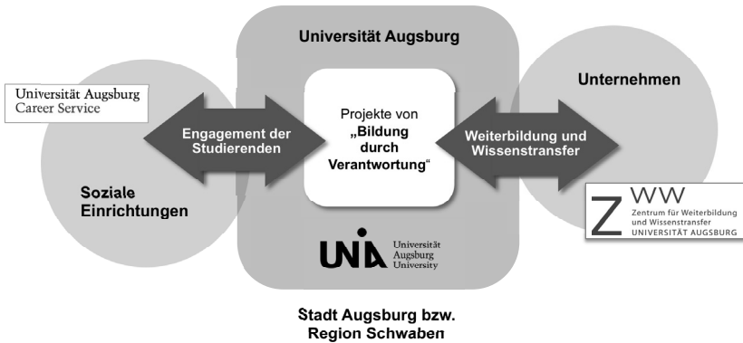
Abb. 3: Kooperation der Universität mit Einrichtungen der Stadt und Region

Um den Augsburger Ansatz zur Integration von gesellschaftlichem Engagement und Verantwortung in Studium und Lehre weiterzuentwickeln, zu verbreitern und neue Projekte durchzuführen, arbeiten drei Einrichtungen der Universität Augsburg zusammen, die bereits über langjährige Erfahrungen und Vorleistungen für das Vorhaben verfügen. Eine beim Vizepräsidenten für Lehre und Studium angesiedelte Koordinationsstelle gewährleistet dabei die Zusammenarbeit der beteiligten Einrichtungen und ist für die Evaluation des Vorhabens verantwortlich.